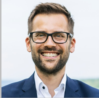
Björn Denner—Erster Bürgermeister