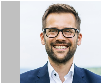
Björn Denner—Erster Bürgermeister