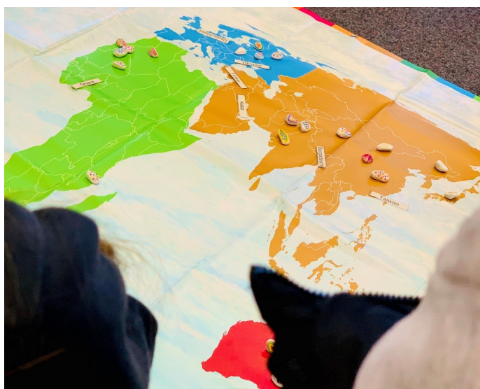
Das Planspiel eröffnet faszinierende Möglichkeiten, die Welt aus einer anderen Perspektive kennenzulernen. (Foto: Manuela Michel / Landkreis Rhön-Grabfeld).

Mit einem spielerisch-forschenden Ansatz strebt das Weltspiel einen Perspektivwechsel an. Es begleitet die Teilnehmenden dabei, neue Einsichten zu gewinnen und Antworten auf wichtige Fragen zu finden: Welche Länder haben sie selbst bereist, und was wissen sie wirklich über sie? Wie verteilen sich die Weltbevölkerung und das Einkommen auf die verschiedenen Kontinente? Welche Länder und wie viele sind in die Produktion eines einfachen Gegenstands wie einer Jeans oder eines Handys involviert? Woher stammen unsere Rohstoffe, und welche Herausforderungen bestehen entlang der Lieferketten? Welche Länder leiden am stärksten unter den Auswirkungen der Klimakrise?