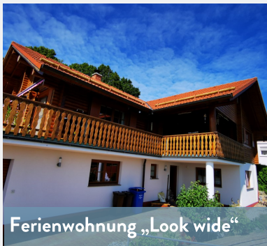
Ferienwohnung „Look wide“

Der Name der Ferienwohnung erklärt diese Trauansicht mit weitem Ausblick auf die Rhön. Die Wohnung verfügt über einen modern gehaltenen Wohn-/ Essbereich inkl. Schlafcouch und TV. Sie ist komplett ausgestattet mit 2 Schlafräumen, Küche mit Spülmaschine, einem Badezimmer mit DU/WC, Waschmaschine und Trockner, kostenfreies WLAN, elektrisches Doppelbett, Hochbett im Nebenzimmer, Babyreisebett u. v. m. Bettwäsche und Handtücher sind inkl. Hundefreunde sind gerne willkommen. Fahrräder können vor der Tür untergestellt werden. Prospekte über Freizeit-