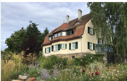
Alte Doktor's Villa

Bed & Breakfast in einer stilvollen alten Villa, inmitten eines im englischen Stil angelegten weitläufigen Gartens.