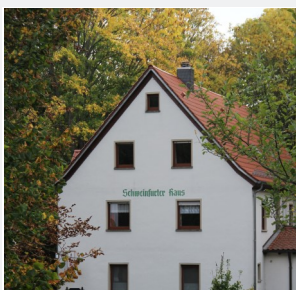
Ferienwohnung Altes Forsthaus

Die Ferienwohnung Altes Forsthaus am Schweinfurter Haus (Schweinfurter Haus s. S. 16) ist idyllisch im Wald gelegen, bietet eine ruhige Lage und unmittelbare Nähe zu verschiedenen Naturdenkmälern.