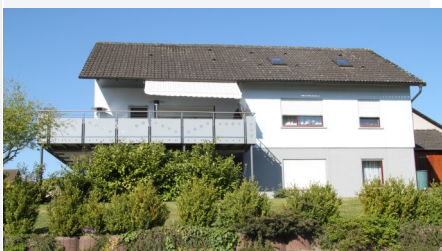
Brunhilde und Ansgar Lenhardt

Die geräumige, gemütlich eingerichtete Ferienwohnung mit zwei Schlafzimmern bietet Platz für bis zu 5 Gäste und ist ideal für Familien.