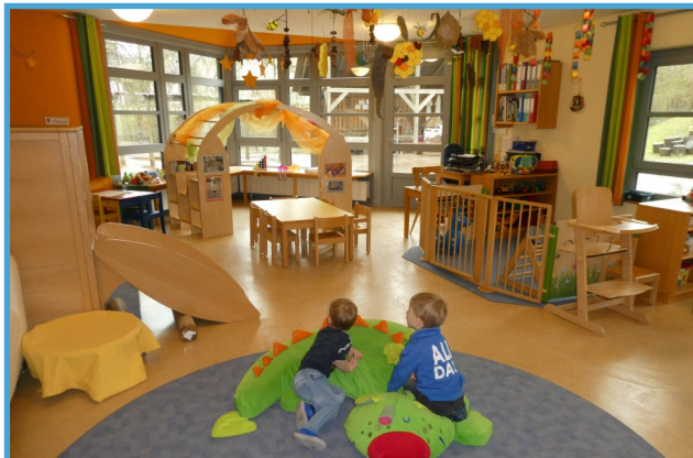
Verschiedene Lernbereiche in der Täubchengruppe.

Krippenkinder lernen mit Freude und mit andere gemeinsam ihren Alltag zu meistern und in ihrer kleinen großen Welt zurecht zu kommen. Im abgegrenzten Außengelände können die Kinder im Sand, auf der Wiese, im Weidentunnel und in den Büschen die Jahreszeiten hautnah und mit allen Sinnen erleben.